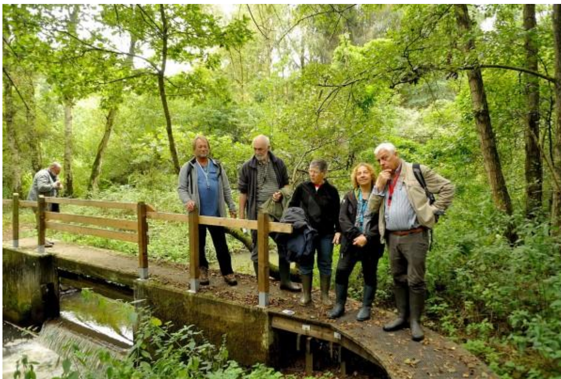
Sommigen keken wel een beetje bedenkelijk