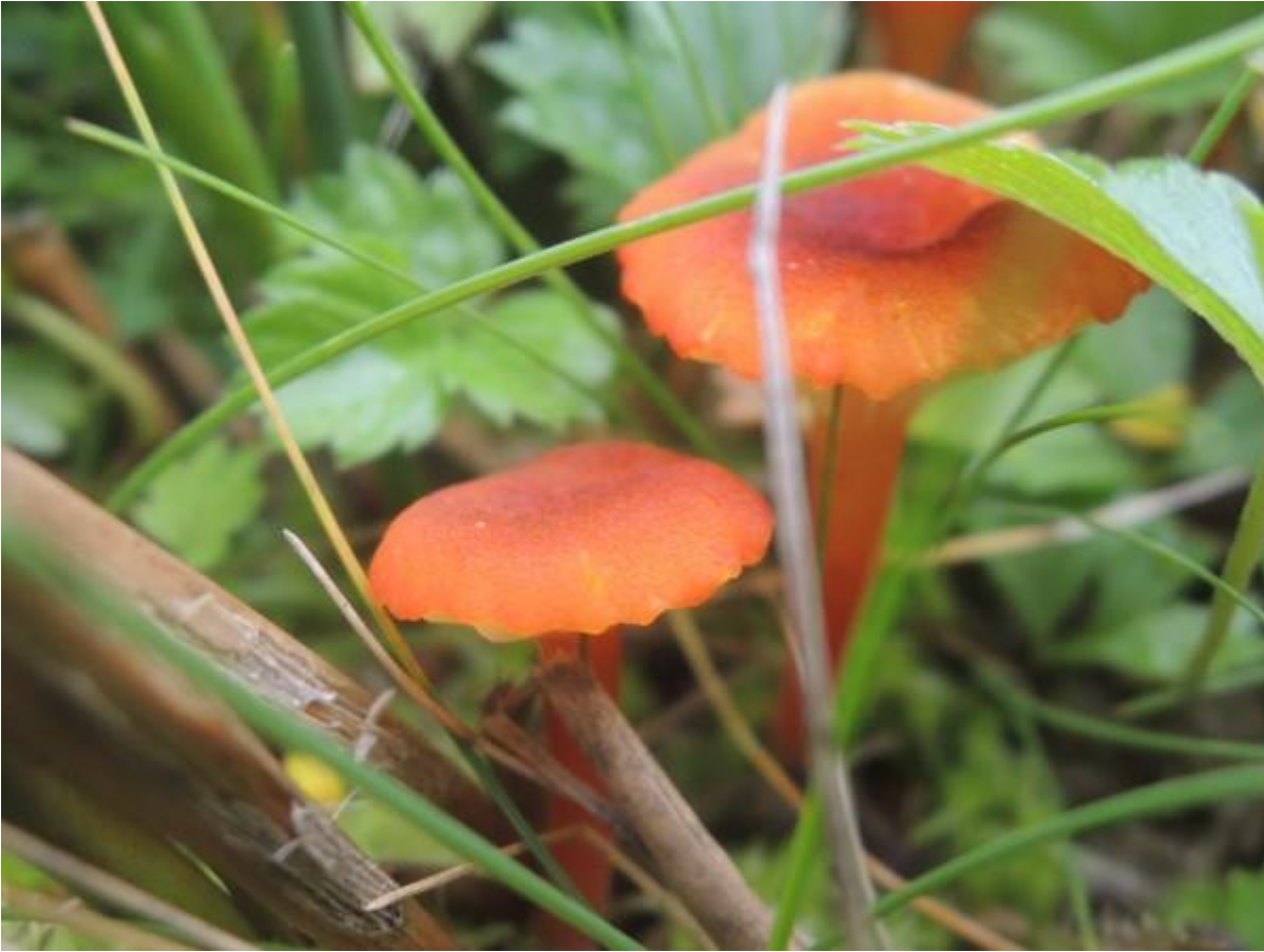
Dit zijn veenmosvuurzwammetjes