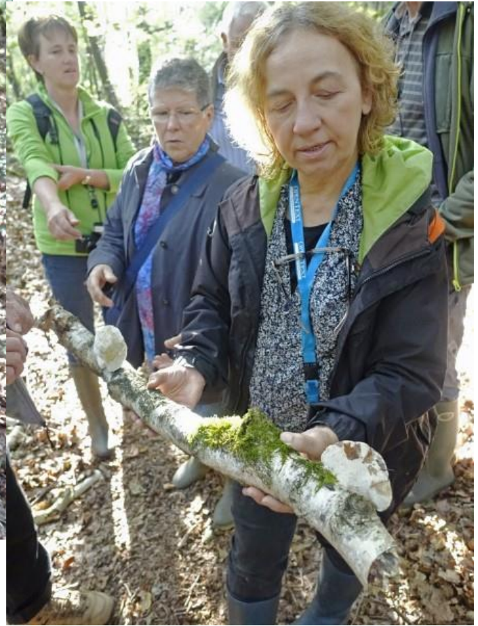
Van heel dichtbij of iets verder werd alles grondig bekeken