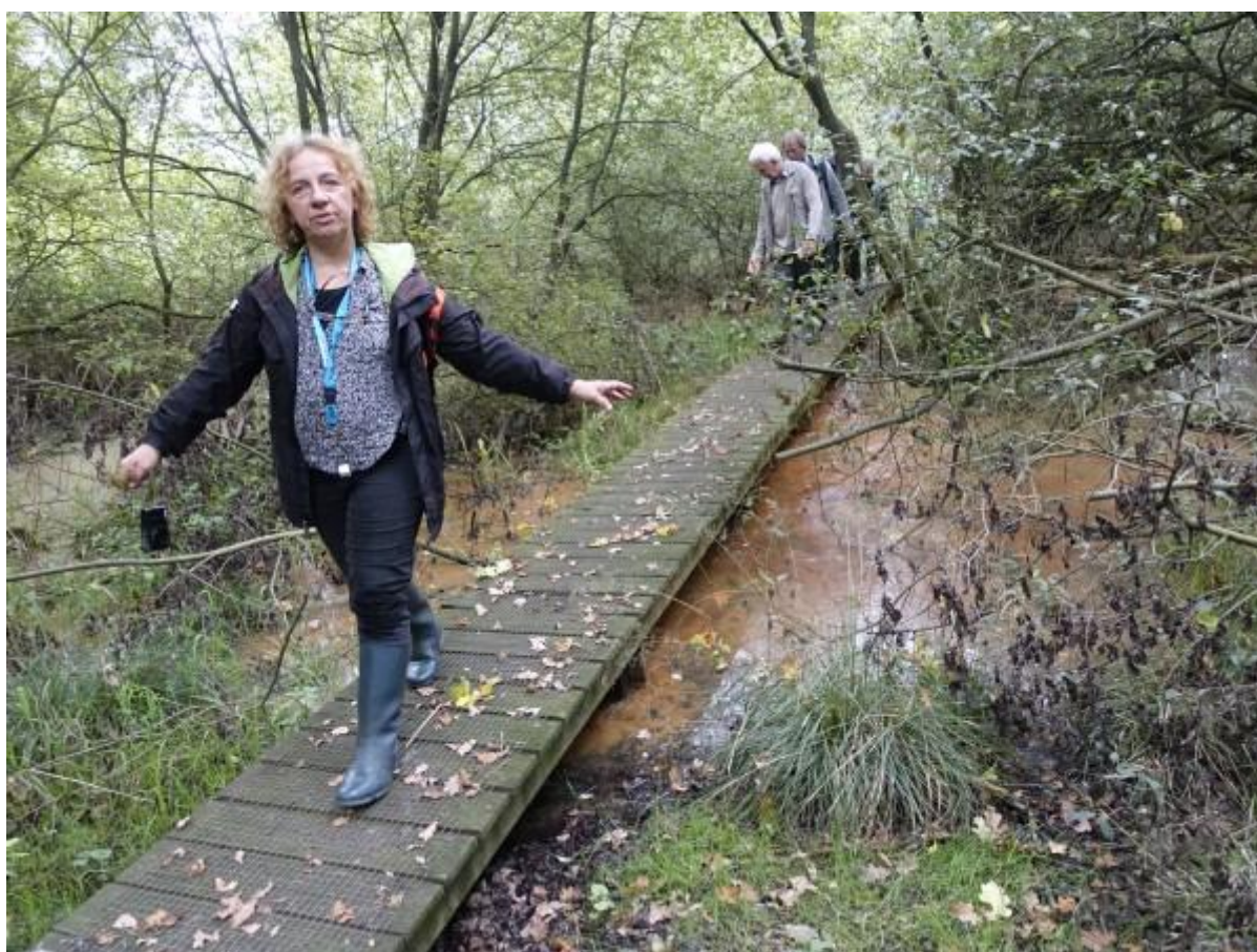
Anderen toonden dat je ook super elegant over een bruggetje kan wandelen