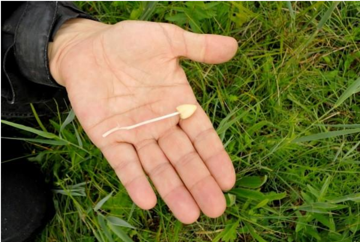
Klein maar fijn dit isabellekleurig breeksteeltje