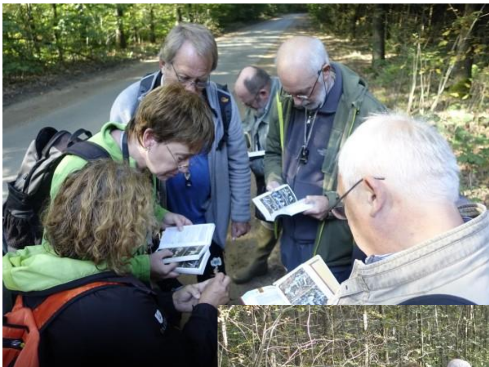
Ze waren weer bijzonder ijverig de Slobkousjes