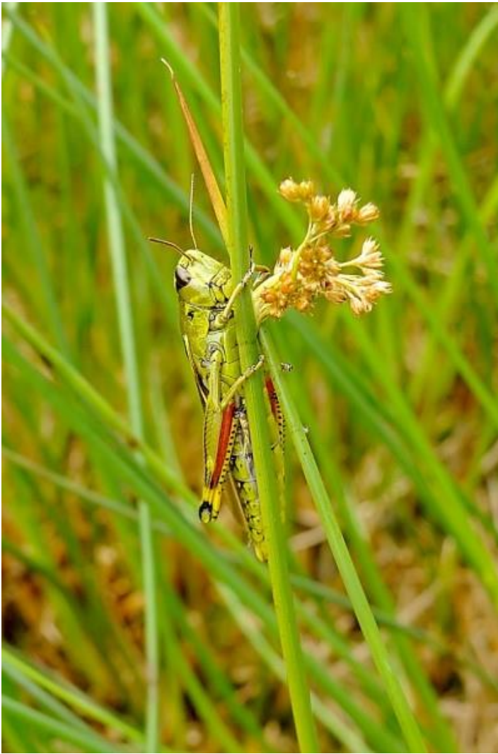
Deze moerassprinkhaan is blijkbaar het huisdier geworden van Paul