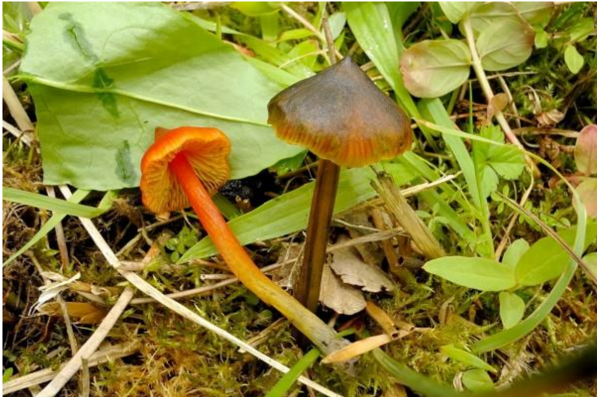
En dit de zwartwordende wasplaten